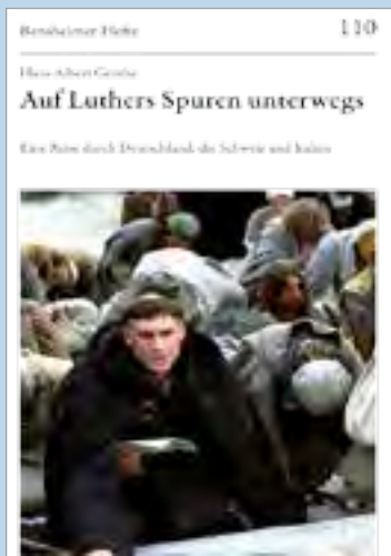
Auf Luthers Spuren unterwegs Eine Reise durch Deutschland, Italien und die Schweiz Hans-A. Genthe (Hg.) Bensheimer Heft 110 14,99 Euro