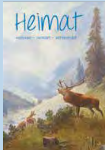
Studientagung „Heimat“ verloren - verklärt - verfremdet Hessen || Österreich 10.-13. März 2016 Eisenstadt (A) Information: www.eb-hessen.de