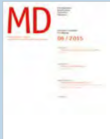
Materialdienst des Konfessionskundlichen Instituts erscheint 6mal im Jahr zu aktuellen ökumenischen Themen Jahres-Abonnement 27,- Euro