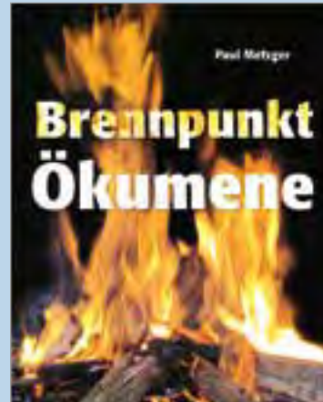
Paul Metzger Brennpunkt Ökumene Möglichkeiten am Ort 1. Auflage 2014 96 Seiten 9,99 Euro