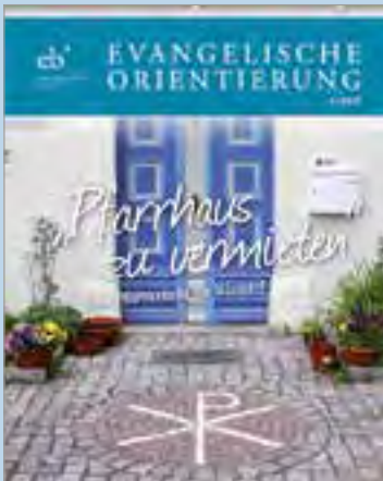
Evangelische Orientierung 4/2015 „Pfarrhaus zu verkaufen“ Das Pfarrerbild im Wandel Mitgliederzeitschrift Mitgliedschaft pro Jahr 25,- Euro